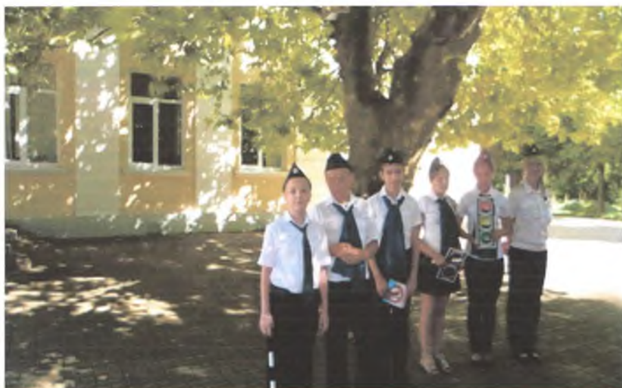
ПРАКТИЧЕСКОЕ ЗАНЯТИЕ С ДОШКОЛЬНИКАМИ «МЫ ИДЕМ В ШКОЛУ»