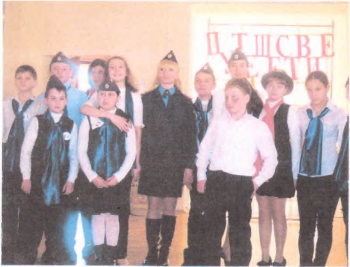
ПРЕЗЕНТАЦИЯ «ТРЕТЬЯ МИРОВАЯ УГРОЗА ЧЕЛОВЕЧЕСТВУ»