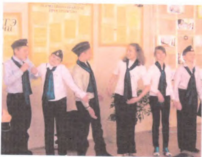
ВИКТОРИНА ДЛЯ ЗРИТЕЛЕЙ