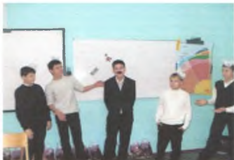
День 8 марта