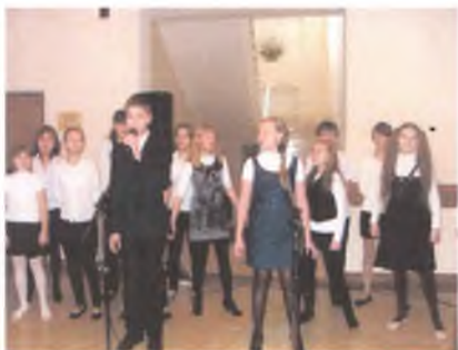
Акция «» 1000 дней до Олимпиады